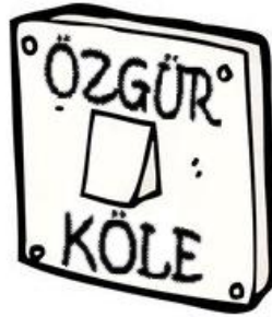
Modern zihnin kölelik anlayışı

Bugünkü işçilik kavramı eski dünyada yoktu. Yeni aldığınız tarlanızı işleyeceksiniz, haber salın da çalışmak isteyen gelsin... Hayır, böyle bir olanak yokmuş. Bugün amele pazarından gündelik işçi aldığınız gibi köle pazarından köle alıyormuşsunuz. Eski dünyadaki köleliğin bugün olmadığı söyleniyor. Bir durup düşünmek gerek öyleyse, köleliğin yerini işçilik almış olabilir mi? Padişahların yerini seçilmişlerin alması örneğinde olduğu gibi bunlar bire bir karşılık değildir elbette. Ancak köleliği anlamak ve böylece bugünkü devamını bulmak için eskiden ücretli emeğin çok ender olduğunu anlamak gerekiyor. Sözgelimi parasız aileler kendilerini veya çocuklarını köle olarak satar veya kiralarlarmış. 4 Hele geçici bir süre için olduğunda işçilikten farkı neredeyse kalmıyor. Modern hurafeci bakışla yazılmış tarih kitaplarında buna “gönüllü kölelik” adı veriliyor. Geçici süreli ve/veya gönüllü köleliğin varlığı “mal olma” tanımının yanlış olduğunu ortaya koyuyor. Seçeneksizlik üzerinden yapılan tanımlar daha doğrudur. 19. Yüzyıl düşünürü Charles Fourier fabrikayı “hafif hapisane” olarak tanımlarken köleyle işçinin arasındaki bu benzerliğe işaret etmiş. İkisinin de seçeneği olmadığı için sömürülmeye razı olur. Kişi kendi üretim aracıyla, kendi emeğiyle geçinebildiği kadar, bir başka deyişle seçeneği olduğu kadar köle değildir. Bu olanaktan yoksunluğumuz bizim köleliğimizin yoğunluğu veya derecesi olur.