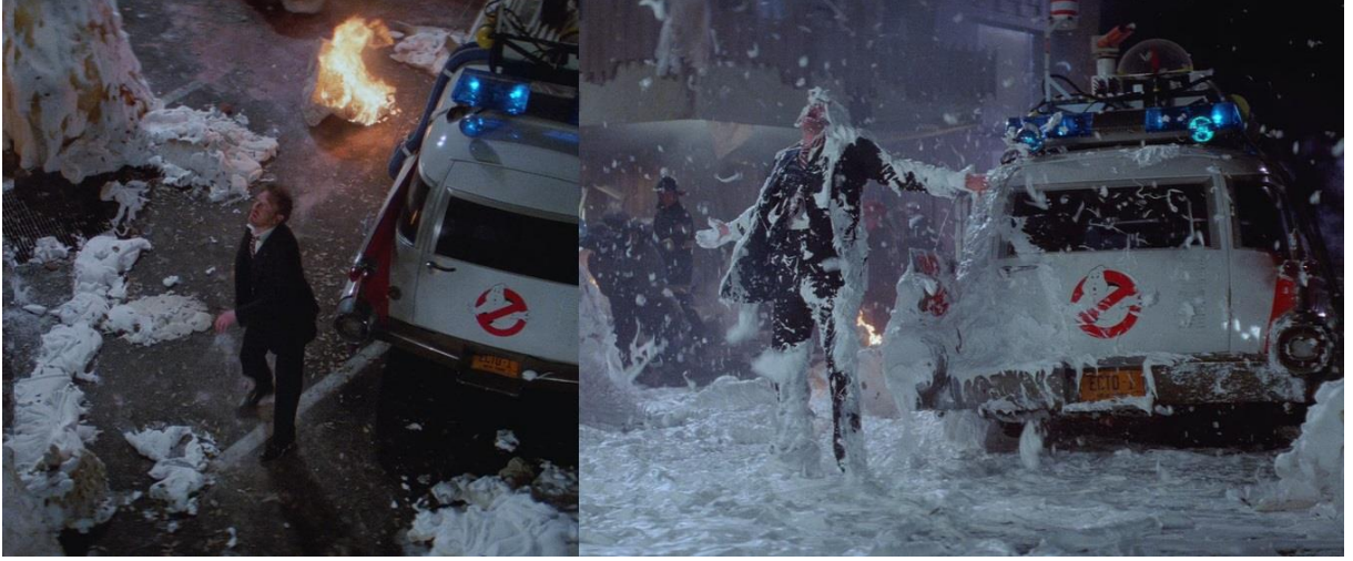
Ne uğraştılar senle Walter...

Ekip çatıdan inip aşağıdaki kalabalığa karışmaya gider. Bu sırada Zed karakteri ellerini iki yana açıp sevinç içinde filmdeki son repliği söyler.