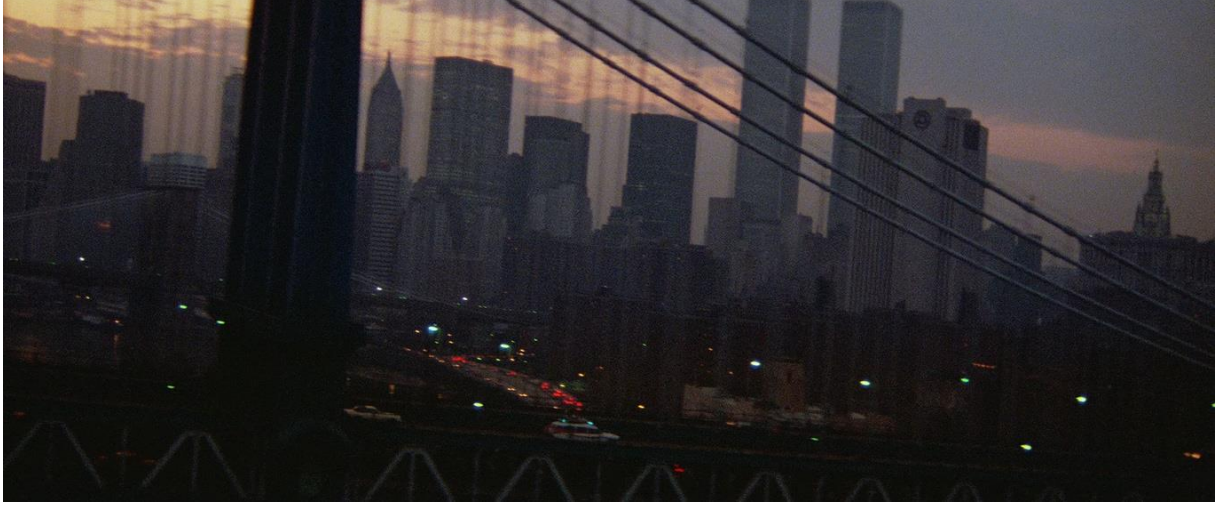
Kamera arabadan uzaklaşmaya başlar ve karanlık bir New York manzarası görürüz. Zed ve Ray'in mahşer gününden bahsetmesinden sonra gelir bu görüntü.

Ben bunu Reddit'ten öğrendim. Bir film hatası olma ihtimalini düşük görüyorum. Ray bilim insanı olduğu ve Tanrı için "henüz tanışmadık" dediği için bu hatayı yapmasını Yeni Ahit bilgisinin zayıflığına yorabiliriz. Çünkü o bilim insanı, okuyup hatırlaması gereken daha önemli ve gerçek kitaplar olmalı değil mi? (ya da bir hata oldu ve filmi çekenlerden kimse fark etmedi, kitap bilgileri zayıf)