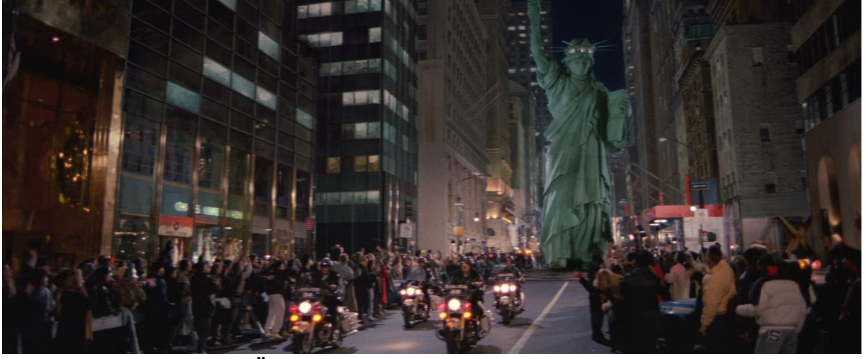
Özgürlük Heykeli New York sokaklarında.

yapabileceği anlatıları çıkarılıyor ve kitlelere din-bilim çatışması varmış gibi anlatılıyor. İki taraftan birini seçmeniz ve diğerine sırt çevirmeniz gerektiğini söyleyenler iyi niyetli değillerdir. Din-bilim meselesi başka yazıların konusu olduğu için bu kadarla yetinip filme dönüyorum.