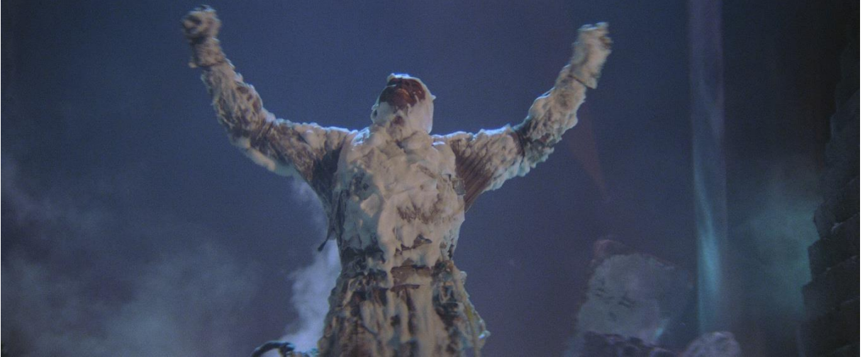
"Bu şehri seviyorum!" Ülke demedi, şehir dedi. Bu vurgunun sebebini ikinci filmde daha iyi anlayacağız.

Ekip çatıdan inip aşağıdaki kalabalığa karışmaya gider. Bu sırada Zed karakteri ellerini iki yana açıp sevinç içinde filmdeki son repliği söyler.