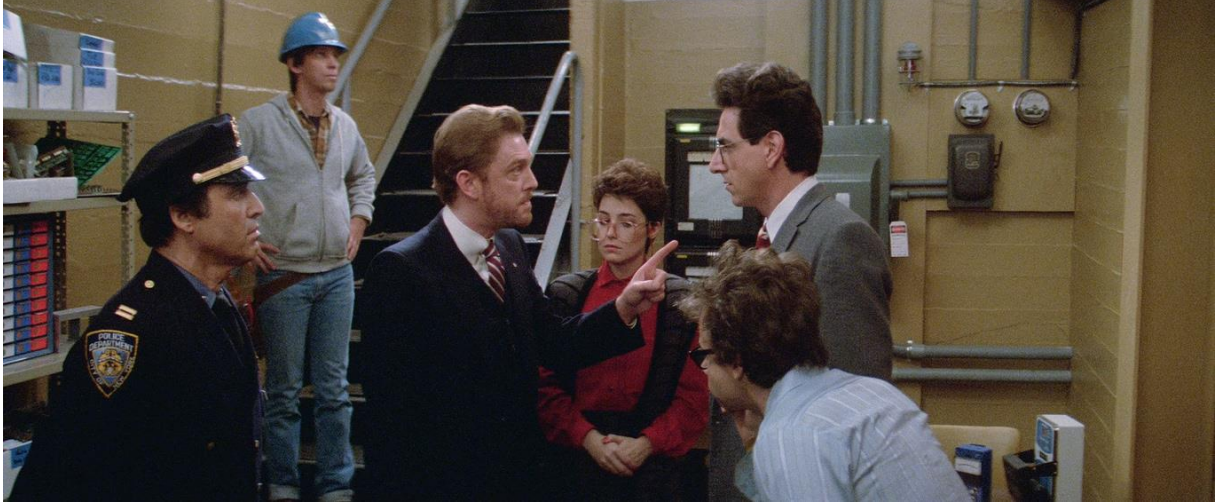
Ekibin bilimcisi Egon bu birimin kapatılmaması gerektiğini basit bir şekilde anlatmaya çalışır. Bu sırada Venkman'da gelir ama çok öfkeli bir profil çizen Walter uyarıları ciddiye almaz ve yetkisini kullanarak üniteyi zorla kapatır.

Venkman'dan posta yiyen Walter bu sefer mahkeme emri, bir polis ve bir teknisyenle geri döner. Yakalanan hayaletlerin depolandığı birimi zorla kapatmak niyetindedir.