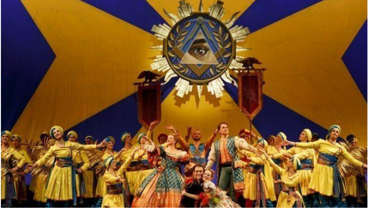
Operanın günümüzde sahnelenmesinden bir örnek

Sihirli flüt ve hayalet avcılığı kurgu eserler olarak mason ve Yahudi yapımcıların zihin dünyasını resmeder. Bu dünyada aşk, sevgi, kardeşlik, özgürlük, bilimin gücü gibi hümanist ve Aydınlanmacı fikirler vardır. İzleyici operada müziğin, sinemada görsel efektlerin etkisiyle bu dünyanın içine girer, bu fikirlerden etkilenir.